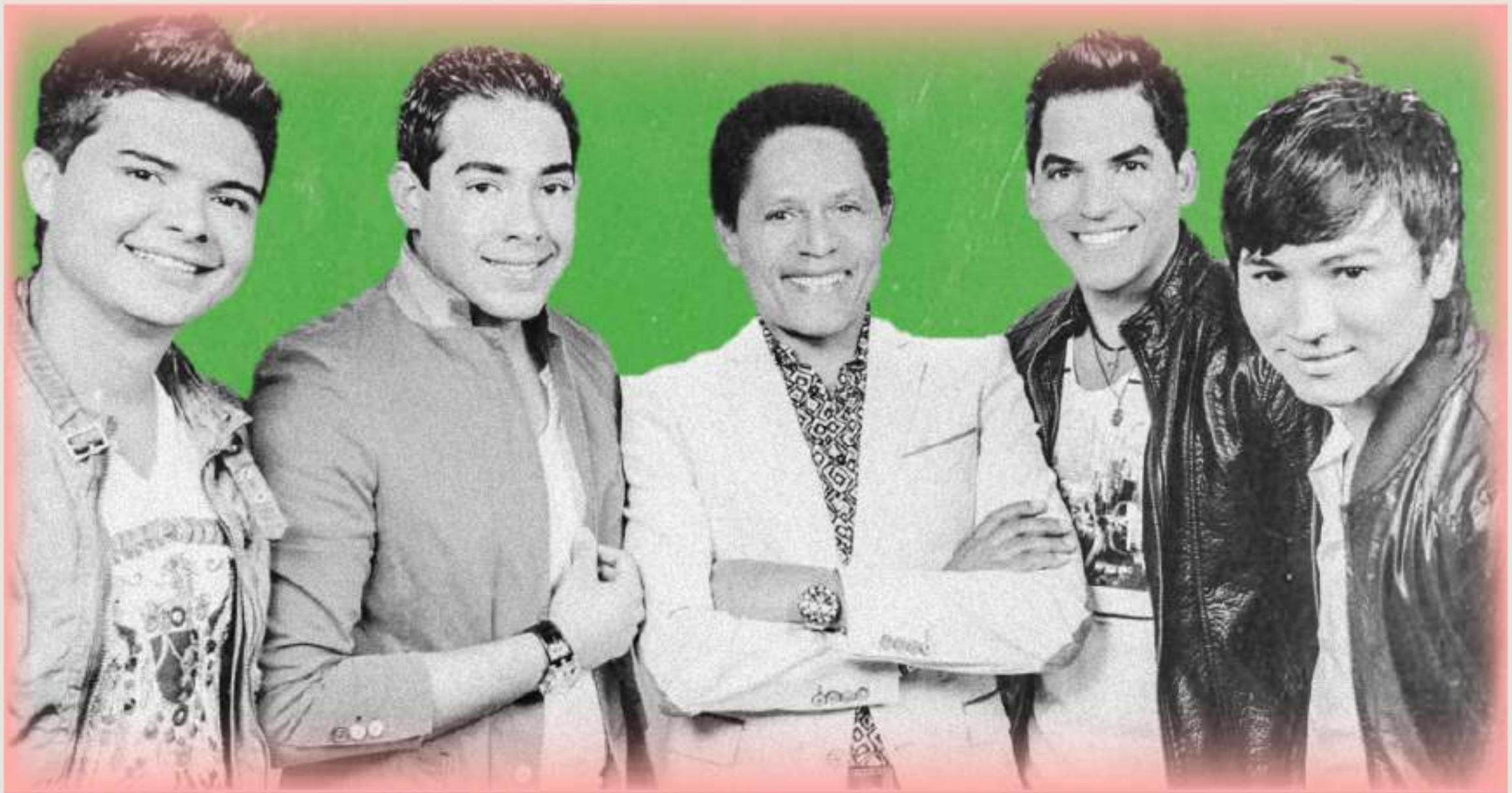
Fotografía: Binomio de Oro de América, www.radiococoa.com .

“Antes de que otra persona a ti llegue Con mentiras a cambiarte mi historia Yo te la vengo a contar (te la vengo a contar) Y escucharás la verdad”.